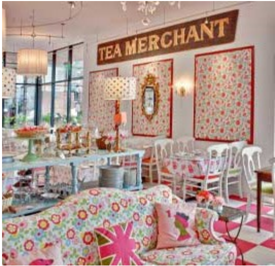
Crown & Crumpet Tea Salon